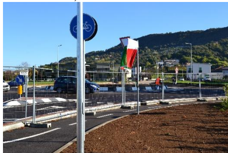
(Via Norma Cossetto coperta con il tricolore)