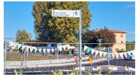
(Via Norma Cossetto)