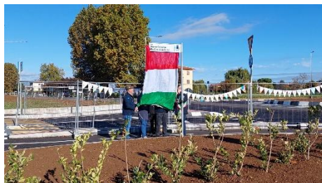
(Il momento della scoperta dell'insegna di via Norma Cossetto)