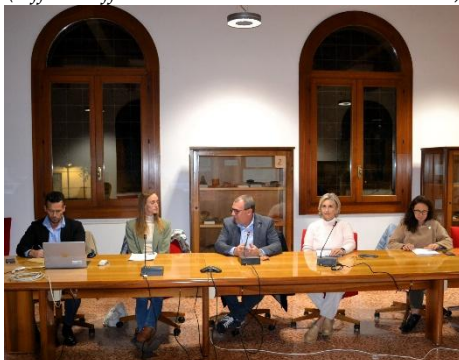
(Presentazione Progetto Green Urb - I relatori)

(Ufficio Affari Generali - Comune di Brendola)