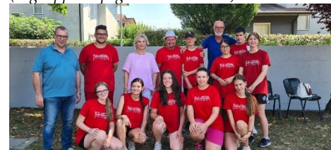
(Il gruppo attivo a Vo' di Brendola)