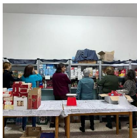
(Associazione Caritas Brendola)