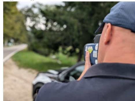
(Il controllo della velocità con il TruCam avviene in presenza di agenti)

(Ufficio Affari Generali - Comune di Brendola)