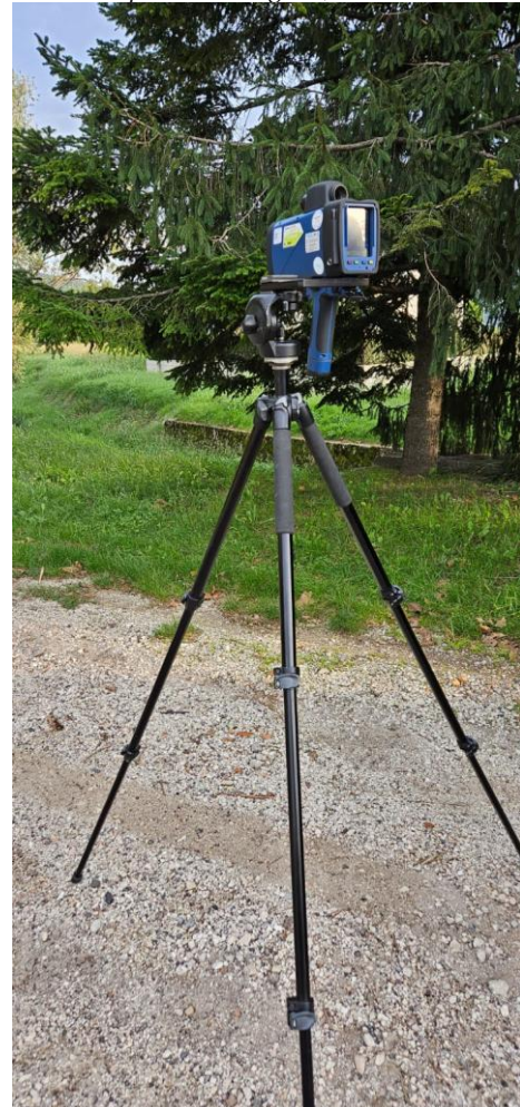
(Il TruCam in dotazione alla Polizia Locale Dei Castelli)