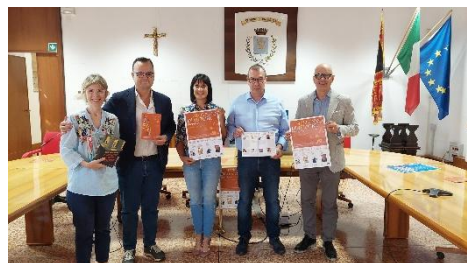
(La conferenza stampa di AUTunno d'AUTore in municipio)

che saranno presentati sono travolti da un fato, a volte infausto, altre benevolo, che permetterà loro di costruire la propria identità eroica ed egoica, attraverso esperienze inserite in contesti spesso drammatici: la guerra, la magia e la follia. Impareremo ad amare le loro vicende, pagina dopo pagina, accompagnati in questo viaggio dalla voce degli stessi inventori delle storie. (Ufficio Affari Generali - Comune di Brendola)