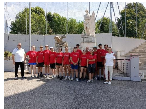
(Il gruppo impegnato a San Vito)

(Ufficio Affari Generali - Comune di Brendola)