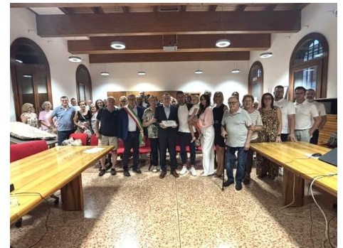
(Consegna Targa Storica ad "Autotrasporti Brunello")

(Ufficio Affari Generali - Comune di Brendola)