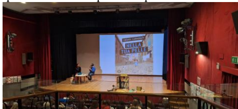
9 ottobre: incontro scrittrice Chiara Carminati.

La scuola è fatta di tante mani, che si intrecciano insieme per fare rete: una rete che sostiene, che protegge e proietta in avanti i ragazzi e le ragazze, testimoni di questi momenti speciali e preziosi.