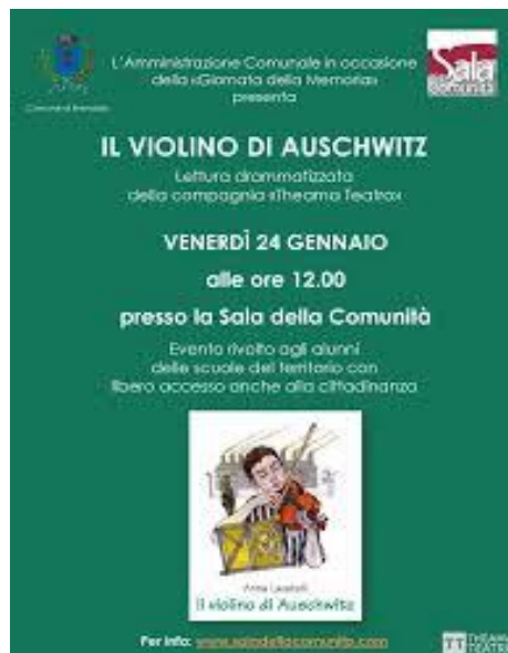
24 Gennaio: Spettacolo di Theama Teatro in occasione della Giornata della Memoria.