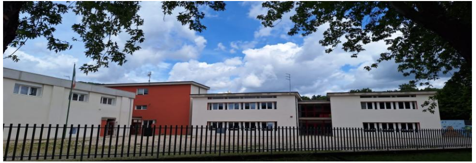
Il cortile della Galilei prima...