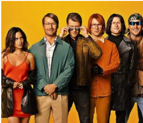
Il killer giusto per ciascun cliente