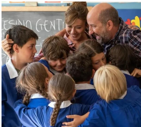
Un maestro che lascia la grande città per insegnare in una scuola di un remoto paese di montagna