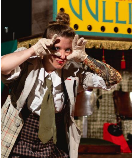
Tutti i viaggi che mi passan per la testa

"Vorresti esplorare un esotico posto? O poter volare verso un regno nascosto? Ami vagabondare nello spazio infinito e correre a perdifiato su di un prato fiorito?" NELLA TERRA DELLA FANTASIA NULLA È IMPOSSIBILE... SEI PRONTO PER UN VIAGGIO IMPENSABILE E INIMMAGINABILE? ALLORA PARTI CON NOI!