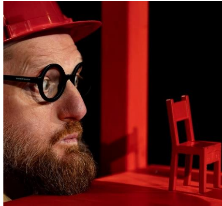
Per diventare grandi

"Che cosa bisogna fare per crescere un po'?" "Dev'essere tutto in ordine! Ma perfetto però!" "Figurati, pensa che monotonia! Io credo che ci voglia anche un po' di fantasia, un pizzico di caos e ...tanta tanta allegria!" ORDINE O CAOS? RAGIONE O FANTASIA? QUANTO TEMPO CI VUOLE A DIVENTAR GRANDI?