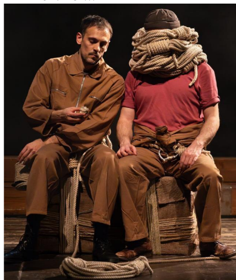
"Noi non abbandoniamo mai il tuo pacco. Non importa quanto tempo dobbiamo aspettare!"