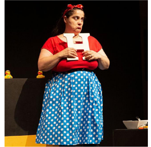
E se le cose fossero al contrario cosa succederebbe?