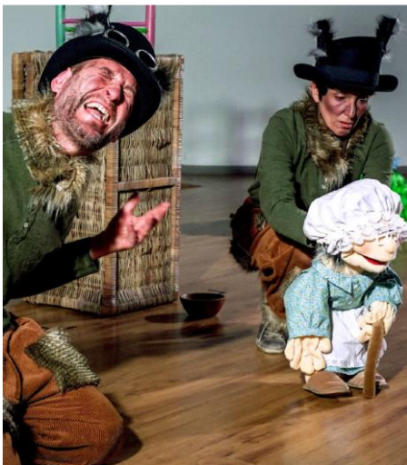
E se fosse il Lupo a raccontare la fiaba di Cappuccetto Rosso?

"Ehi tu, lupastro, fermati immediatamente!" "Che vuoi, bambina furba e insolente?" "Non crederai, lupaccio di passarla impunemente?" "Ragazzina, smettila di far la prepotente..." POVERA CAPPUCETTO... POVERO LUPO... COME "POVERO" LUPO? UN LUPO LUPACCIO LUPASTRO NON PUO' ESSERE POVERO! ... OPPURE SI'?!