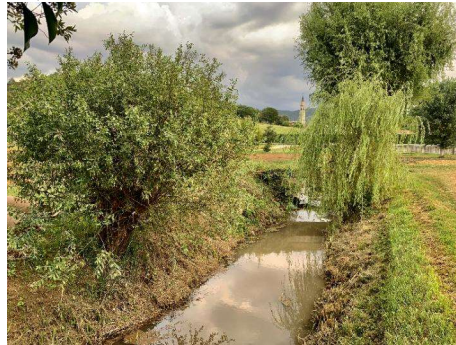
(Secondo classificato: Maran Riccardo, 2A)