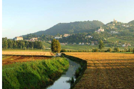
(Terzo classificato: Canaglia Elena, 3C)