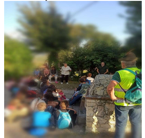
(Le classi prime nel PERCORSO DELLE FONTANE - S.Vito)

Arrivederci al prossimo anno, con nuovi temi, idee e spunti!