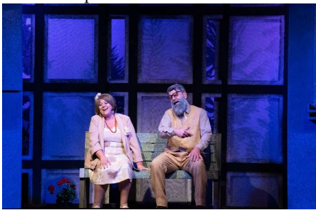
(Sala della Comunità)

Per parlare d'amore, di genitori e figli e di sentimenti profondi.