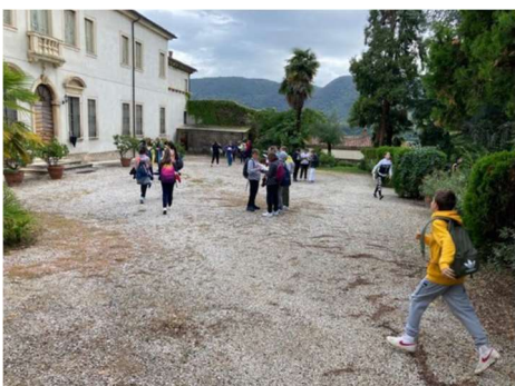
Classi seconde Galilei a Villa Rossi: caccia al tesoro!