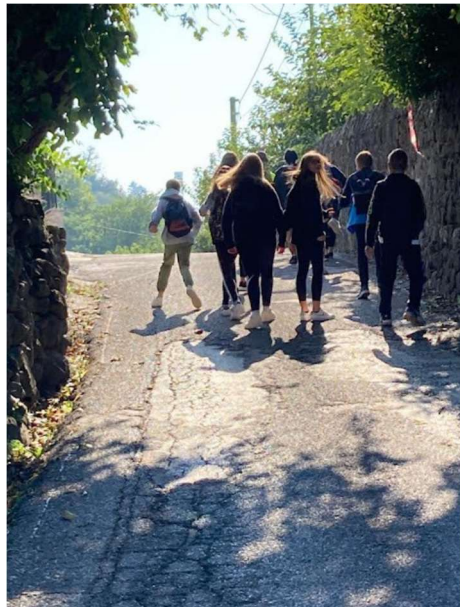
Classi terze Galilei: sulle tracce di Bertilla lungo la Via dei Carri.