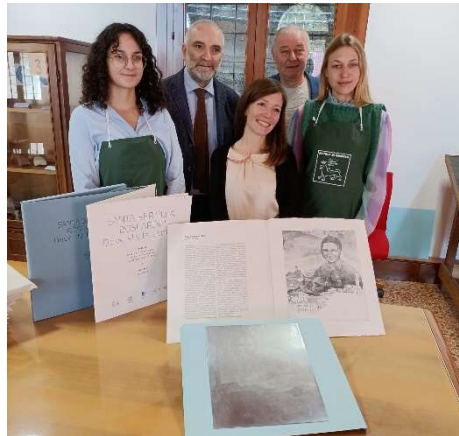
(Comitato per le celebrazioni del Centenario della morte di Santa Bertilla)

Per chi desidera avere maggiori informazioni, trova una copia in visione nella segreteria della parrocchia (dal lunedì al venerdì, dalle 8.30 alle 12 e dalle 15 alle 17), oppure chiamando al numero 0444 400844.