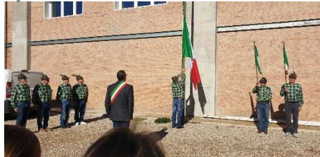
(Ufficio degli Affari Generali - Comune di Brendola)