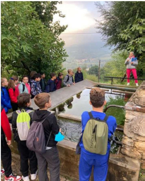
Classi prime Galilei alla fontana di San Vito: lettura di una fiaba.