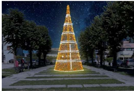
Nella foto il rendering dell’albero di Natale che sarà allestito in Piazza Mercato

Quindi, l’amministrazione comunale quest’anno offrirà un nuovo format per il Natale, una novità che i commercianti, i ristoranti e le altre attività del commercio hanno accolto con favore, poiché auspicano tutti che, nonostante le difficoltà di questi tempi, la cornice di dicembre sarà certamente festosa.