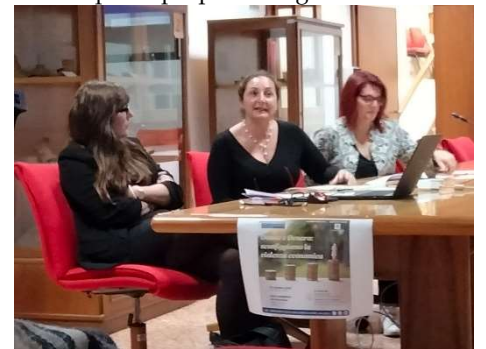
(Ufficio Affari Generali – Comune di Brendola)

Con questo primo incontro di educazione finanziaria si intende attivare un processo virtuoso al fine di avere cittadini di ogni età informati, attivi, responsabili e consapevoli al momento delle scelte economiche per sé stessi e per la propria famiglia.