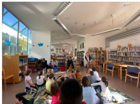
Classi prime Boscardin: letture animate in biblioteca con i lettori volontari.