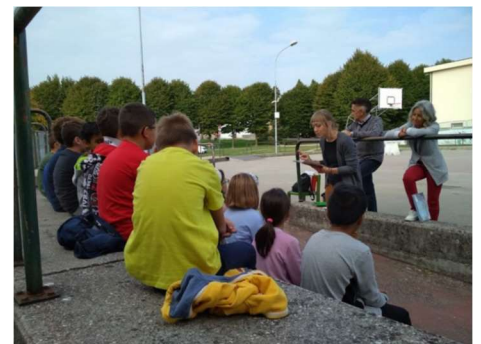
Classi quarte Boscardin: letture animate in piattaforma con i lettori volontari.

I ragazzi e ragazze hanno potuto godere di guide esperte, di letture piacevoli da parte dei lettori volontari, si sono cimentati in cacce al tesoro e quiz vari... Sempre presenti gli Alpini che hanno fatto sì che il percorso non fosse mai disagiata o con intoppi.