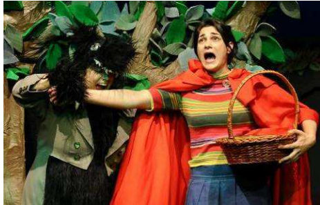
Domenica 27 ottobre ore 16 - BUONGIORNO VECCHIA SIGNORA Stivalaccio teatro di Vicenza

stratta e fa poca attenzione a quello che le viene detto e questo, a volte, può essere un bel guaio. Soprattutto se ti sei persa nel bosco e l'unico a cui chiedere informazioni è un lupo affamato. E così, tra boschi, carretti, lupi, nonne e cacciatori, le buffe avventure delle nostre beniamine si incrociano e si mescolano con la fiaba di Cappuccetto Rosso, ancora una volta opportunamente riveduta e "scorretta"!