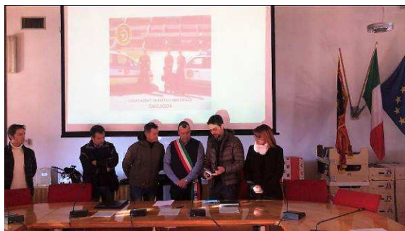
Riceviamo (08/01/2019) e pubblichiamo: