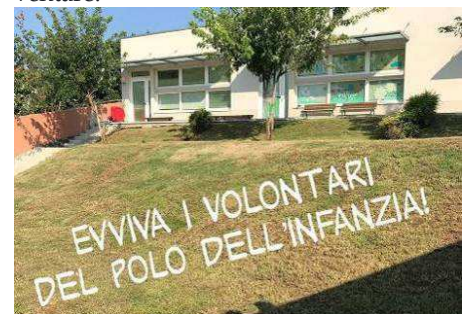
(Il Polo dell'Infanzia)

A nome dei bambini e di quello che, anche grazie all'impegno e all'esempio dei nostri volontari speciali, un giorno potranno diventare.