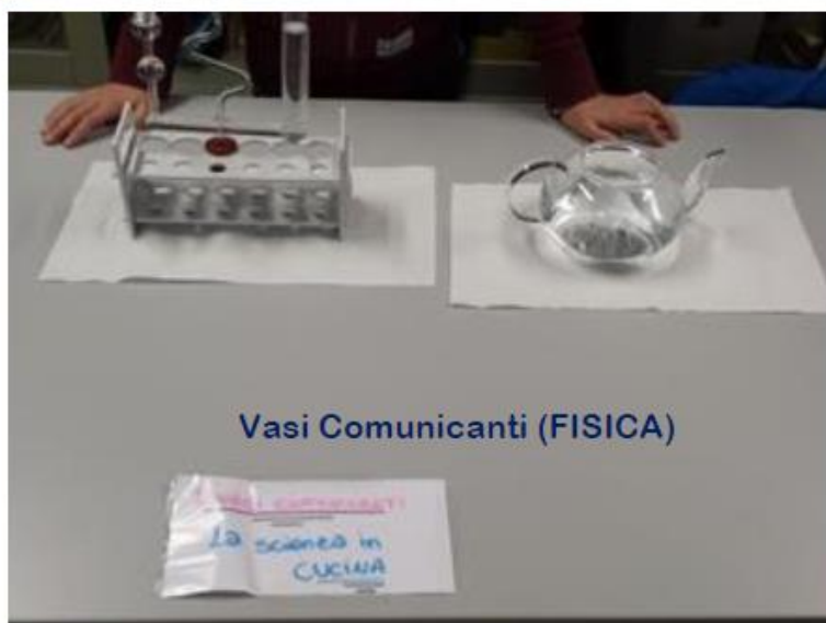
Vasi Comunicanti (FISICA)