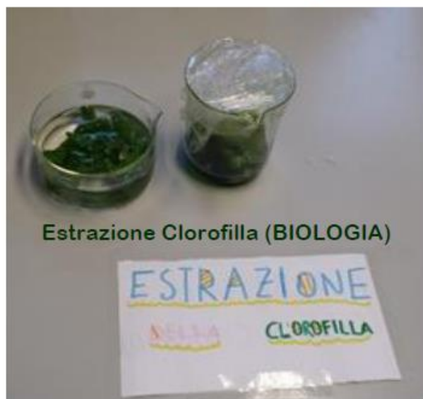
Estrazione Clorofilla (BIOLOGIA)