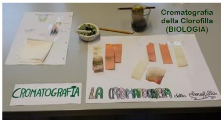
Cromatografia della Clorofilla (BIOLOGIA)

Un ringraziamento a tutto il personale per aver organizzato scuola aperta con tanta passione, professionalità ed efficienza.